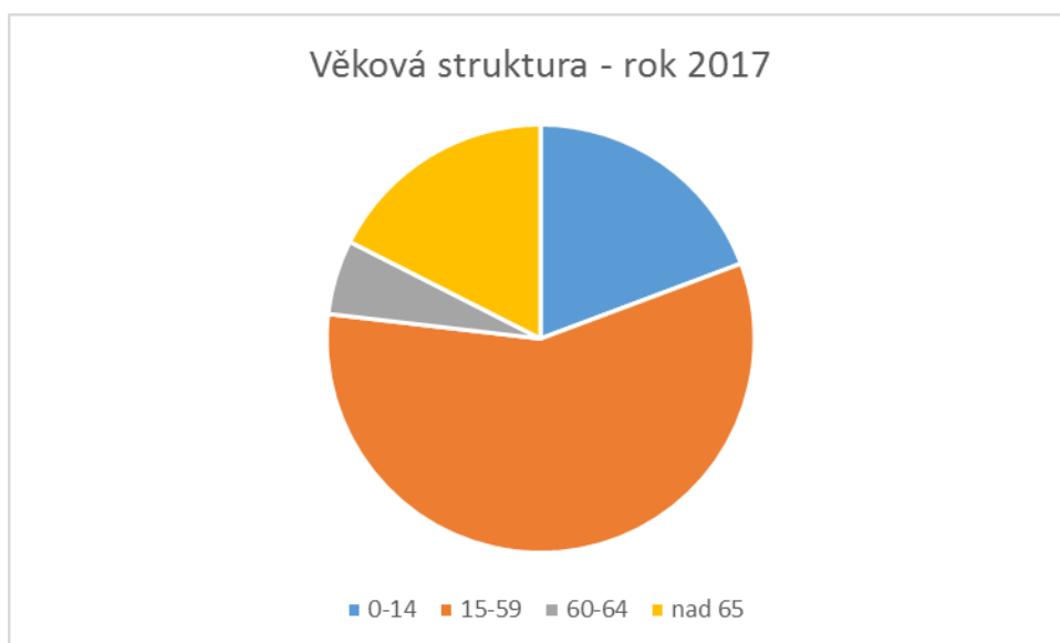
Graf č. 2 – Aktuální věková struktura