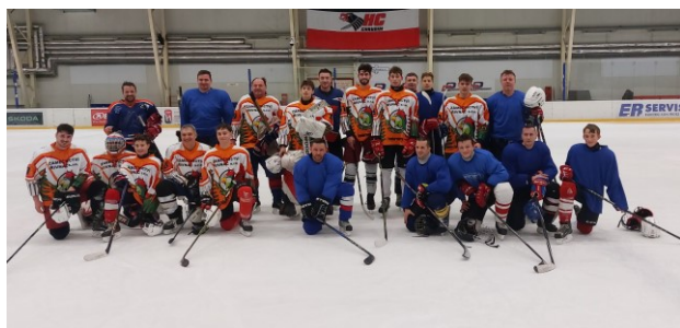
Hokejové derby - prosinec 2024