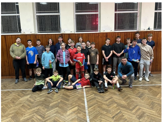
Dětský florbalový turnaj - prosinec 2024