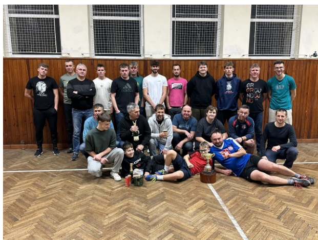
Florbalový turnaj - prosinec 2024