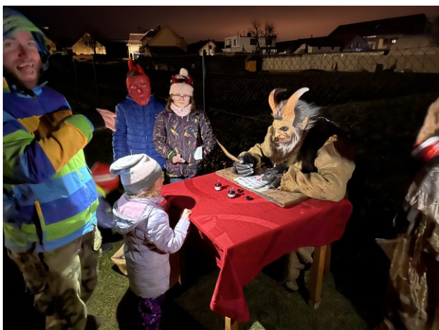
Čertovské putování - prosinec 2024