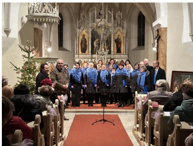
Pěvecký sbor Slavoj Chrudim - prosinec 2024