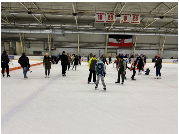
Vánoční bruslení - prosinec 2024